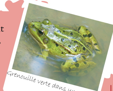
Grenouille verte dans une mare..

L'appauvrissement du milieu et le déclin des sources de nourriture sont parmi les principales causes de diminution du nombre d'espèces d'oiseaux, de papillons, d'insectes pollinisateurs, ... Si vous souhaitez donner un "coup de pouce" ou participer activement à la protection de la biodiversité, vous pouvez dès à présent faire de nombreuses actions bénéfiques dans votre jardin, sur votre balcon, dans vos jardinières... Aménager des habitats, favoriser la flore locale, abandonner les traitements chimiques, sont autant de gestes qui feront de vous un bienfaiteur de la biodiversité. Participer aux 100 refuges et s'engager au respect de la charte est un premier pas... laissez vous guider !